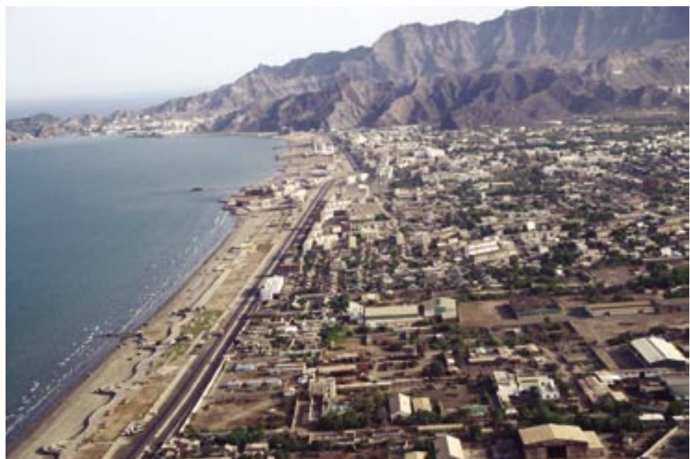
Yahya Mohammed Al-Showaibi

On pense que les villes du Yémen font partie des agglomérations urbaines les plus vieilles du monde et qu'elles ont été, sur le plan historique, les centres culturels et économiques du pays. Aujourd'hui, elles subissent des contraintes importantes dues à la croissance rapide de la population (3,6%), aux niveaux élevés de pauvreté (25,3% de la population urbaine yéménite vit en dessous du seuil de pauvreté supérieur 1 ), aux ressources en eau limitées et aux capacités municipales réduites 2 . Ces contraintes sont aggravées par l'augmentation de la mi-